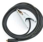
Earth return cable 5 m, 16 mm 2